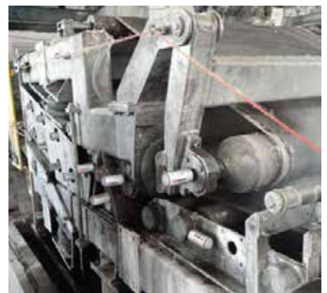
製紙機械への複数のシマルーベ125の取付事例