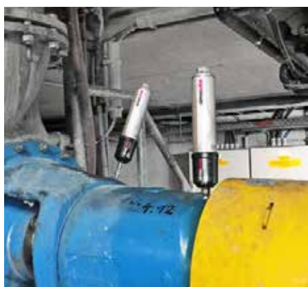
ポンプ設備へのシマルーベ250とインパルス取付事例