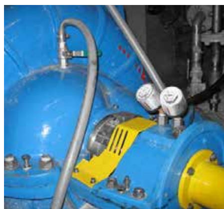
ポンプ設備へのシマルーベ30取付事例