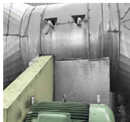
換気設備のベアリングへのシマルーベ15とシマルーベ125取付事例