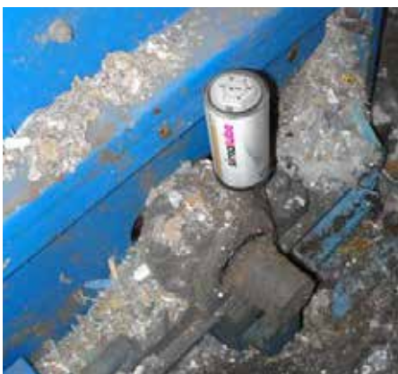
シュレッダーのベアリングへのシマルーベ125の取付事例