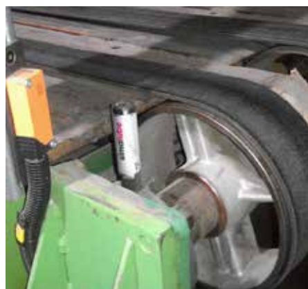
段ボール工場設備の移動ベルトへのシマルーベ15の取付事例