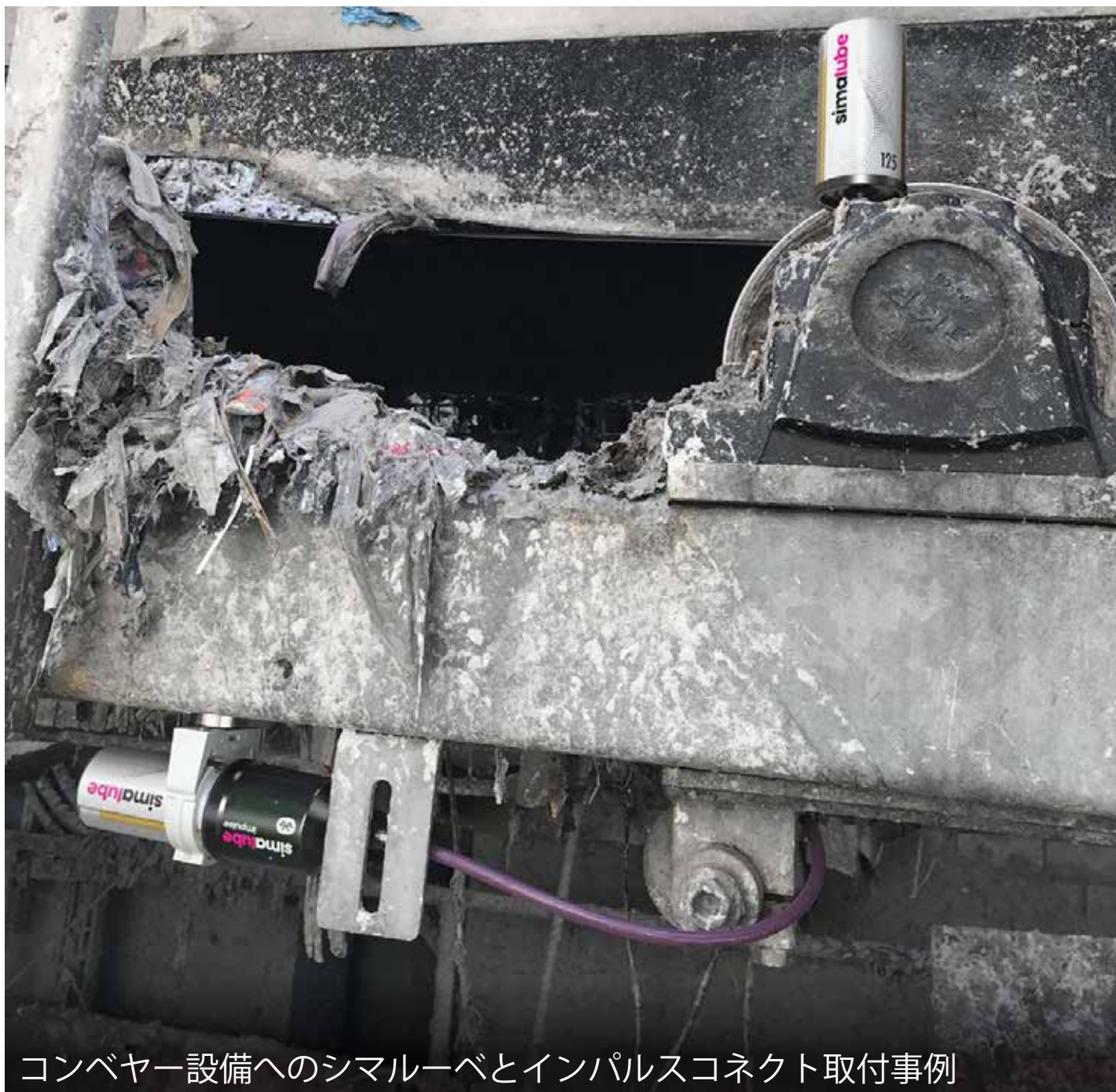
コンベヤー設備へのシマルーベとインパルスコネクタ取付事例